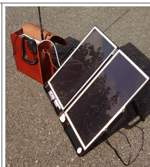
ERP300 + valise solaire avec béquille déployable

Cet appareil se situe entre les émetteurs-récepteurs portatifs de faible puissance portatifs à main avec faible autonomie et les stations fixes de forte puissance en VHF.